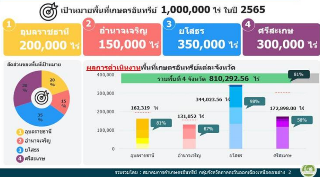
ภาพรวม : ผลการดำเนินงานการขับเคลื่อนเกษตรอินทรีย์กลุ่มจังหวัดภาคตะวันออกเฉียงเหนือตอนล่าง 2